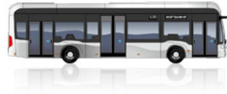
eCitaro fuel cell 3 deuren

Lengte [mm]: 12.135 Draaicirkel [mm]: 21.214 Hoogte [mm]: 3.450 Breedte [mm]: 2.550