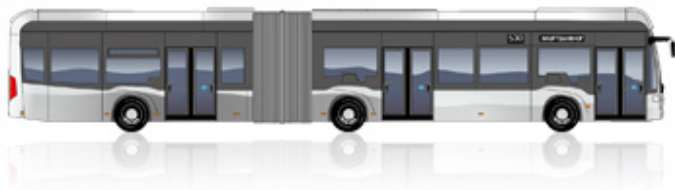
eCitaro G fuel cell 3 deuren

Lengte [mm]: 18.125 Draaicirkel [mm]: 22.970 Hoogte [mm]: 3.450 Breedte [mm]: 2.550