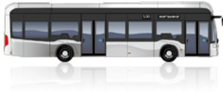
eCitaro fuel cell 2 deuren

Lengte [mm]: 12.135 Draaicirkel [mm]: 21.214 Hoogte [mm]: 3.450 Breedte [mm]: 2.550