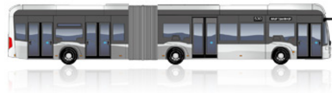
eCitaro G fuel cell 4 deuren

Lengte [mm]: 18.125 Draaicirkel [mm]: 22.970 Hoogte [mm]: 3.450 Breedte [mm]: 2.550